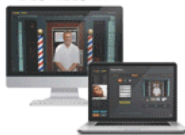
그림 반응속도훈련용 모니터

실력의 마지막 단계 공개작업 (Go Public)으로 실전경험을 축적시켜줍니다.